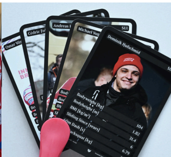
Quardett der CH Bob-Elite

Schreiben Sie mir eine E-Mail mit der Artikel Nr. oder als Vermerk auf dem Einzahlungsschein.